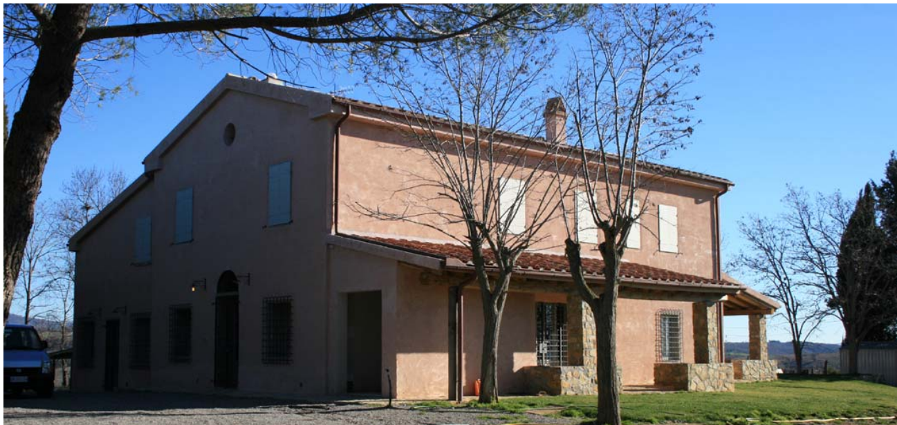
MAGLIANO in TOSCANA – Casale

LUOGO DEL PROGETTO: ROMA – Villino al mare OGGETTO: Progetto di ristrutturazione e arredo interno - Località Santa Severa. Progetto di Massima ANNO DI PROGETTAZIONE: 2005 ENTE FINANZIATORE: Privato