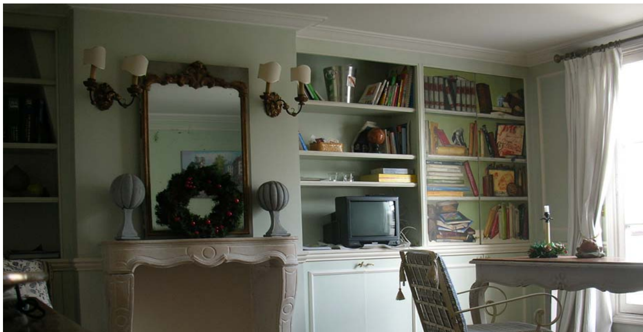
PARIGI – Appartamento Rue Casimir Perier

LUOGO DEL PROGETTO: ROMA – Studio Legale Tonucci OGGETTO: Progetto di ristrutturazione e arredo interno - Piano 3 via Principessa Clotilde 7 Progetto Esecutivo Direzione dei lavori ANNO DI PROGETTAZIONE: 1999 - Realizzato ENTE FINANZIATORE: Studio Tonucci