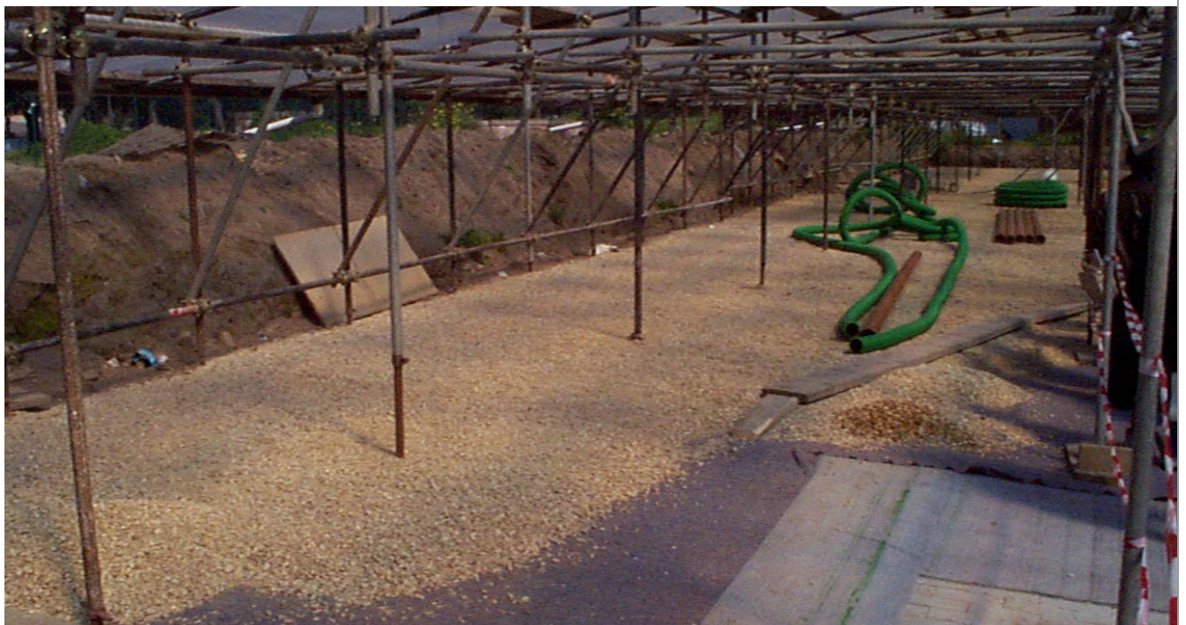
ROMA – Domus Aurea

LUOGO DEL PROGETTO: MILANO - Palazzo del Senato OGGETTO: Recupero funzionale, adeguamento impiantistico e alla normativa di sicurezza del Palazzo del Senato sede dell'Archivio di Stato - Indagini Specialistiche - Direzione lavori ANNO DI PROGETTAZIONE: 1999 – 2003 - eseguito ENTE FINANZIATORE: Ministero per i Beni e le Attività Culturali – Ufficio Centrale Beni Archivistici - Servizio Tecnico Edilizia Archivistica