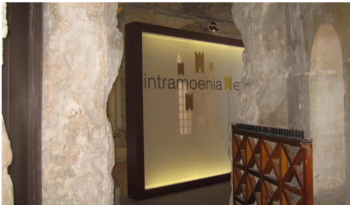
ANDRIA – Castel del Monte