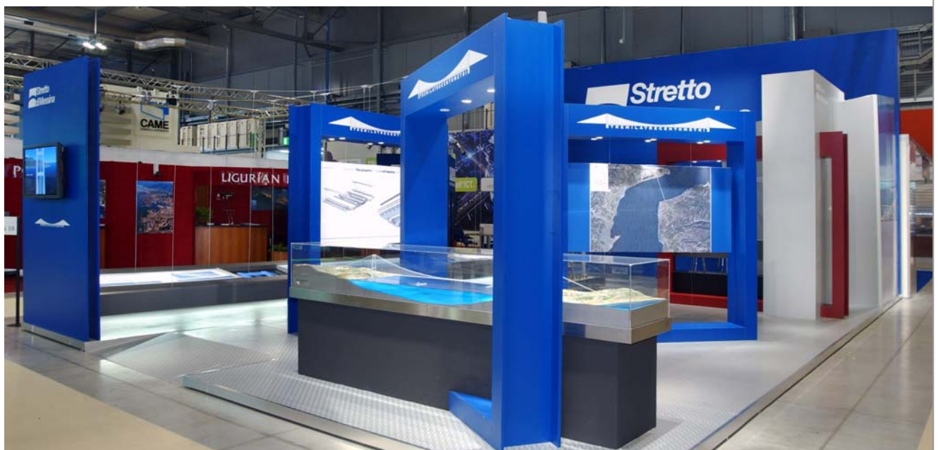
MILANO – Stand Stretto di Messina Spa

LUOGO DEL PROGETTO: OSAKA OGGETTO: Progetto per l’esposizione fieristica “25th Osaka International Trade Fair” Progetto Preliminare ANNO DI PROGETTAZIONE: 2002 ENTE FINANZIATORE: Edindustria S.p.A.