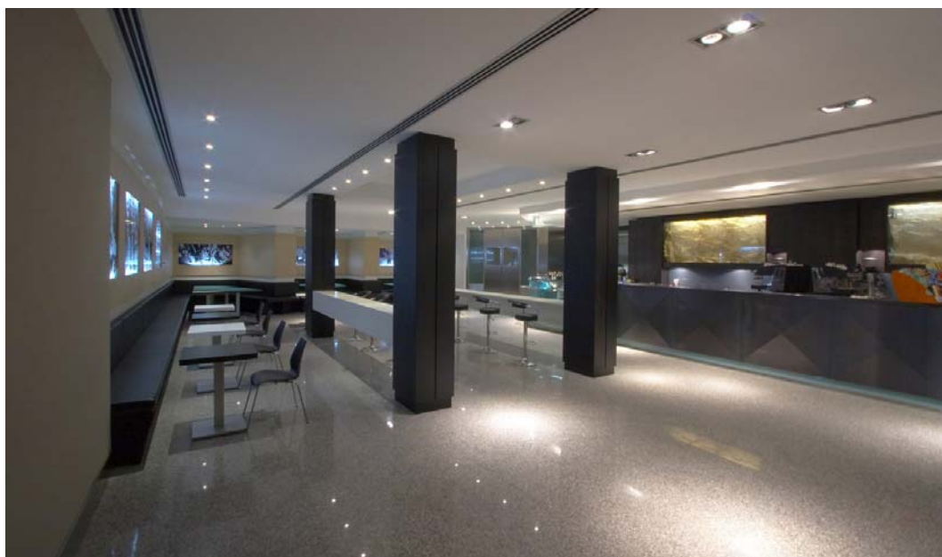
ROMA – La Caffetteria RAI – via Teulada

LUOGO DEL PROGETTO: PARIGI – Appartamento, Rue Vieille du Temple OGGETTO: Progetto di ristrutturazione e arredo interno - Rue Vieille du temple 79 Progetto Esecutivo Direzione dei lavori ANNO DI PROGETTAZIONE: 2006 - Realizzato ENTE FINANZIATORE: Privato