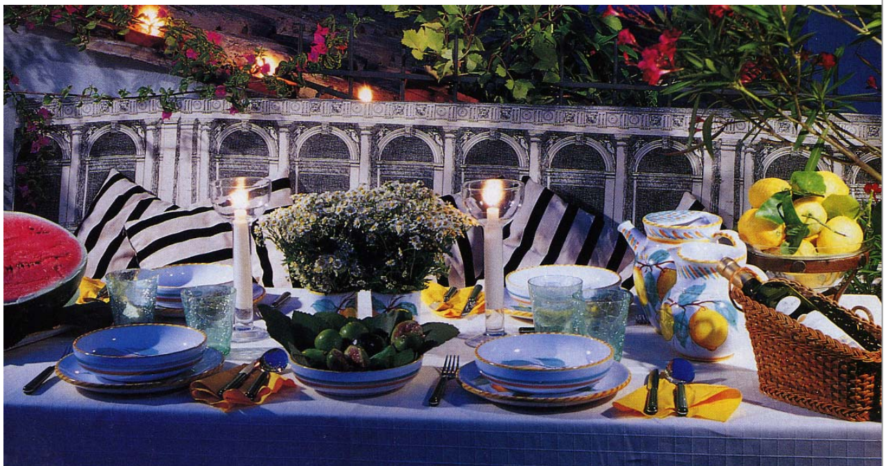
ROMA – Appartamento via Condotti