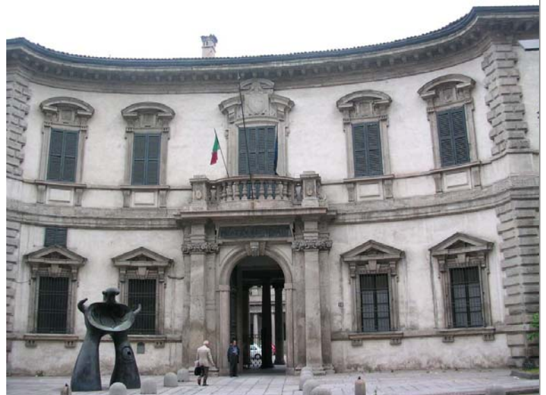
MILANO – Palazzo del Senato